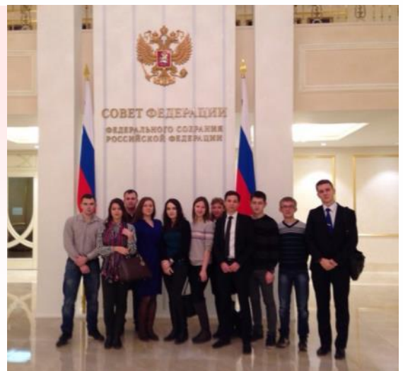
Заседание клуба в Совете Федерации

Члены клуба побывали в здании Совета Федерации, смогли увидеть телевизионную «кухню», а также не упустили возможности задать вопросы лектору.