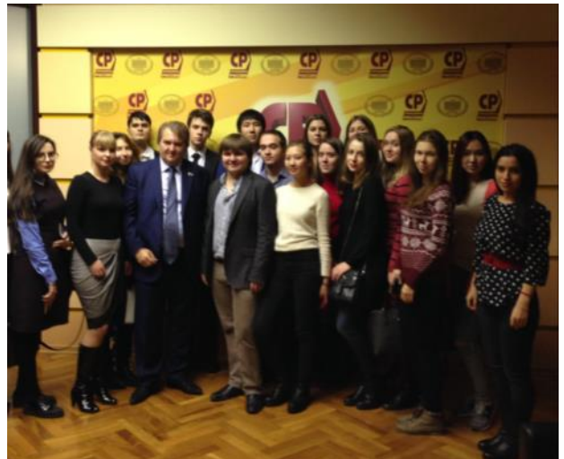
Заседание клуба в Государственной Думе

В ходе экскурсии были изучены основные аспекты деятельности Государственной Думы: стадии законодательного процесса, организация работы и деятельности комитетов Государственной Думы, статус депутата Государственной Думы и формы его работы, роль фракций в Государственной Думе. Получение студентами теоретических знаний сопровождалось наблюдением за работой Государственной Думы в режиме реального времени. Участники экскурсии стали живыми свидетелями правительственного часа, проходящего в рамках пленарного заседания, побывали в гостях у всех четырех фракций Государственной Думы, а также были приглашены в рабочий кабинет одного из депутатов. В завершение экскурсии студенты посетили музей Государственной Думы, где им были представлены исторические документы Государственной Думы, фотографии известных депутатов и написанные ими книги, некоторые издания о Государственной Думе.