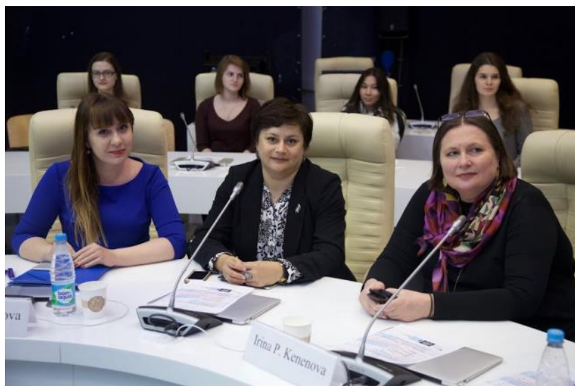
Онлайн-конференция с Университетом Денвера