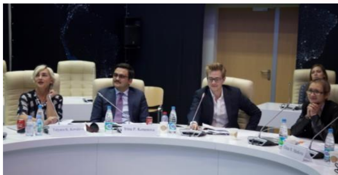
Онлайн-конференция с Университетом Денвера