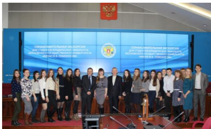
Заседание в Центральной Избирательной комиссии